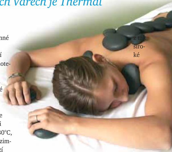
z tak- širo- ké

nabídky si vybere opravdu každý. Pro lázeň- ské pobyty rodin s dětmi je vybudován dětský koutek, který je vítaným doplňkem služeb.